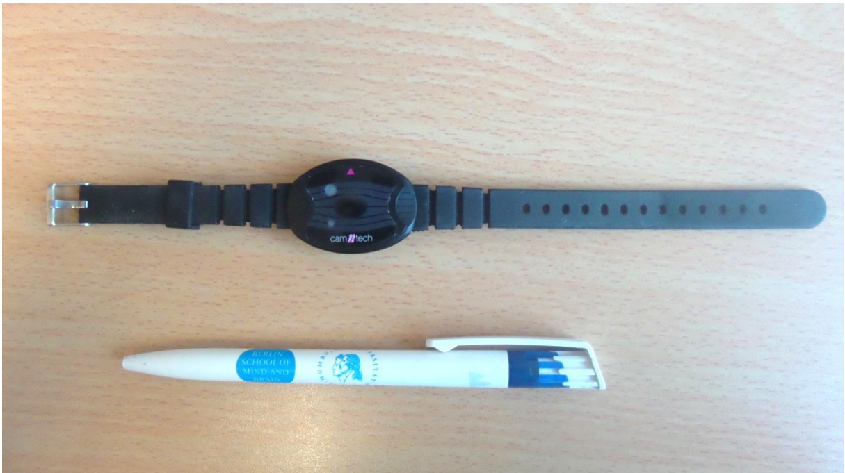
Figuur 2: De Camntech MotionWatch 8® accelerometer (boven) in vergelijking met een alledaags object (een pen).