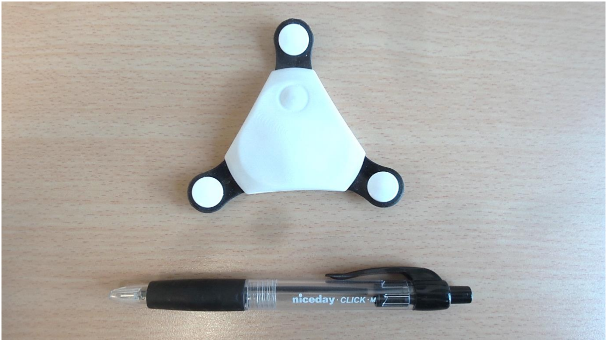
Figuur 1: De Cortrium C3 (boven) in vergelijking met een alledaags object (een pen).